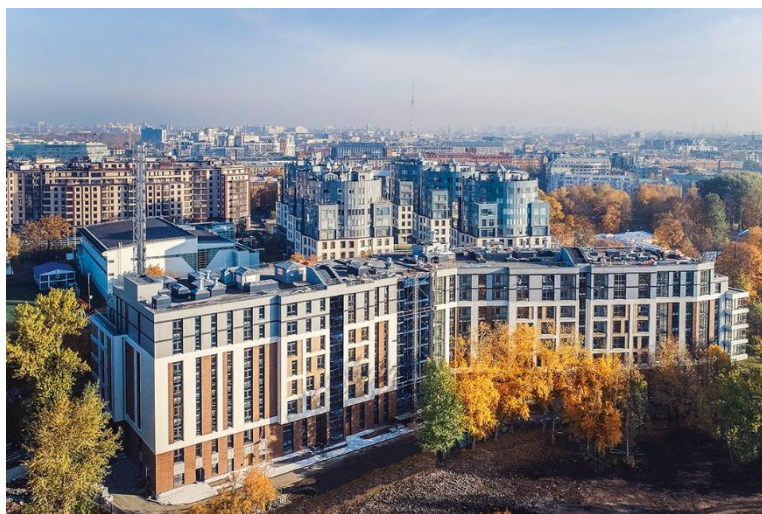
Рис.1 ул.Ремесленная д.21 лит.А

МФК AVATAR от застройщика «Строительный трест» станет вторым по счету проектом компании с апартаментами. 8-этажный кирпично-монолитный дом будет иметь ступенчатую форму со светлыми фасадами с большой площадью остекления.