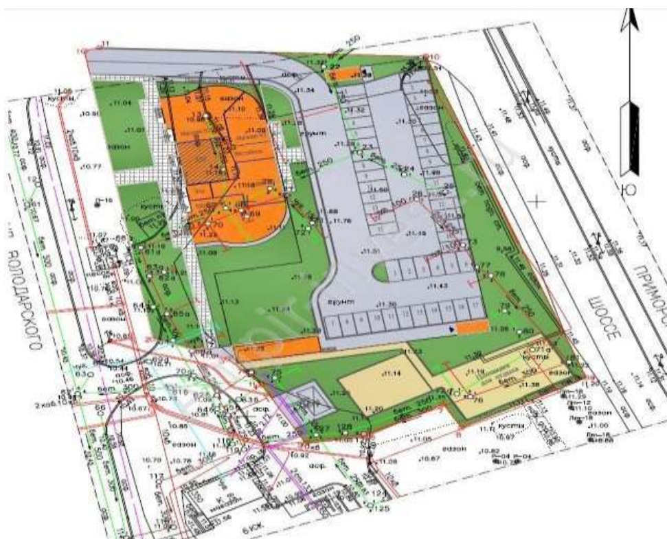
рис.2.Приморское шоссе, дом 352, лит.1

В настоящее время участок свободен от застройки. Площадь участка - 5395,0 кв.м.; Ближайшие станции метро: М Комендантский проспект (27891 метр) М Старая Деревня (28756 метров) М Парнас (29577 метров)