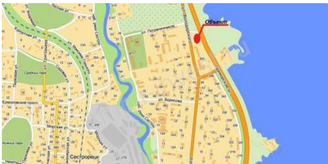
Рис.1 Приморское шоссе, дом 352, стр1, участок

В настоящее время участок свободен от застройки. Площадь участка - 5395,0 кв.м.; Ближайшие станции метро: М Комендантский проспект (27891 метр) М Старая Деревня (28756 метров) М Парнас (29577 метров)