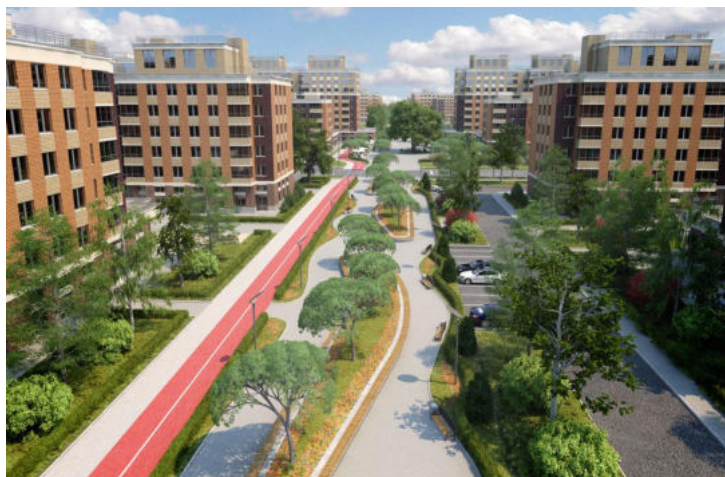
Рис.1 п. Новоселье, жилищный комплекс Метро: Проспект Ветеранов Район: Ломоносовский

Объект оценки расположен в Ленинградской области, Ломоносовский р-н, МО Аннинское сельское поселение, п. Новоселье